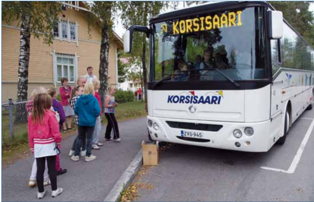
Kampanjan ensimmäinen tilaisuus oli Rajamäen koululla. Se järjestettiin aktiivisesti toimivan Rajamäen Koti ja Koulu ry:n aloitteesta jo ennen varsinaista kampanjaviikkoa 8. syyskuuta.

N urmijärvellä on käynnissä ainutlaatuisen joukkoliikenteen koulukampanja, jonka toteuttaa Nurmijärvilippu-työryhmä. Liikennekasvatusviikolla 13.-17. syyskuuta tavoitettiin lähes kaikki ekaluokkalaiset, joille valistusta levitettiin näytelmän sekä viihteen keinoin.