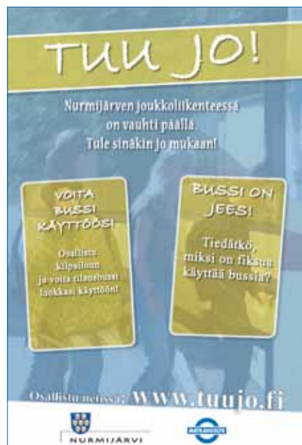
Nuorisokampanjan juliste innostaa käymään www.tuujo.fi -sivuilla ja osallistumaan nettikilpailuun, joka jatkuu lokakuun loppuun.