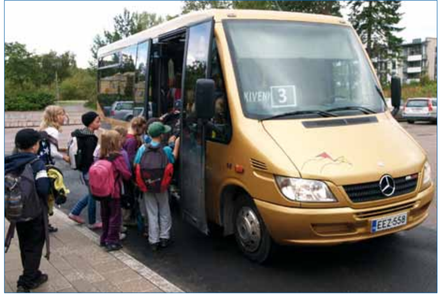
Kivenkyydin liityntälinjoilla kulkee runsaasti myös koululaisia. Tässä noudetaan kotiin lähteviä alakoululaisia Lukkarin koululta.

Ennen aamuyhdeksää ja iltapäivän kolmen jälkeen ajetaan ns. liityntälinjoja, joita